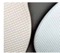
マジックしゃもじ/魔法のしゃもじ