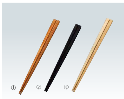
※チャンプは天然京華木。食器洗浄機・保管庫対応可